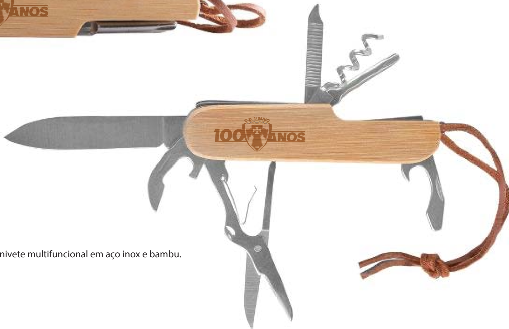
Canivete multifuncional em aço inox e bambu.