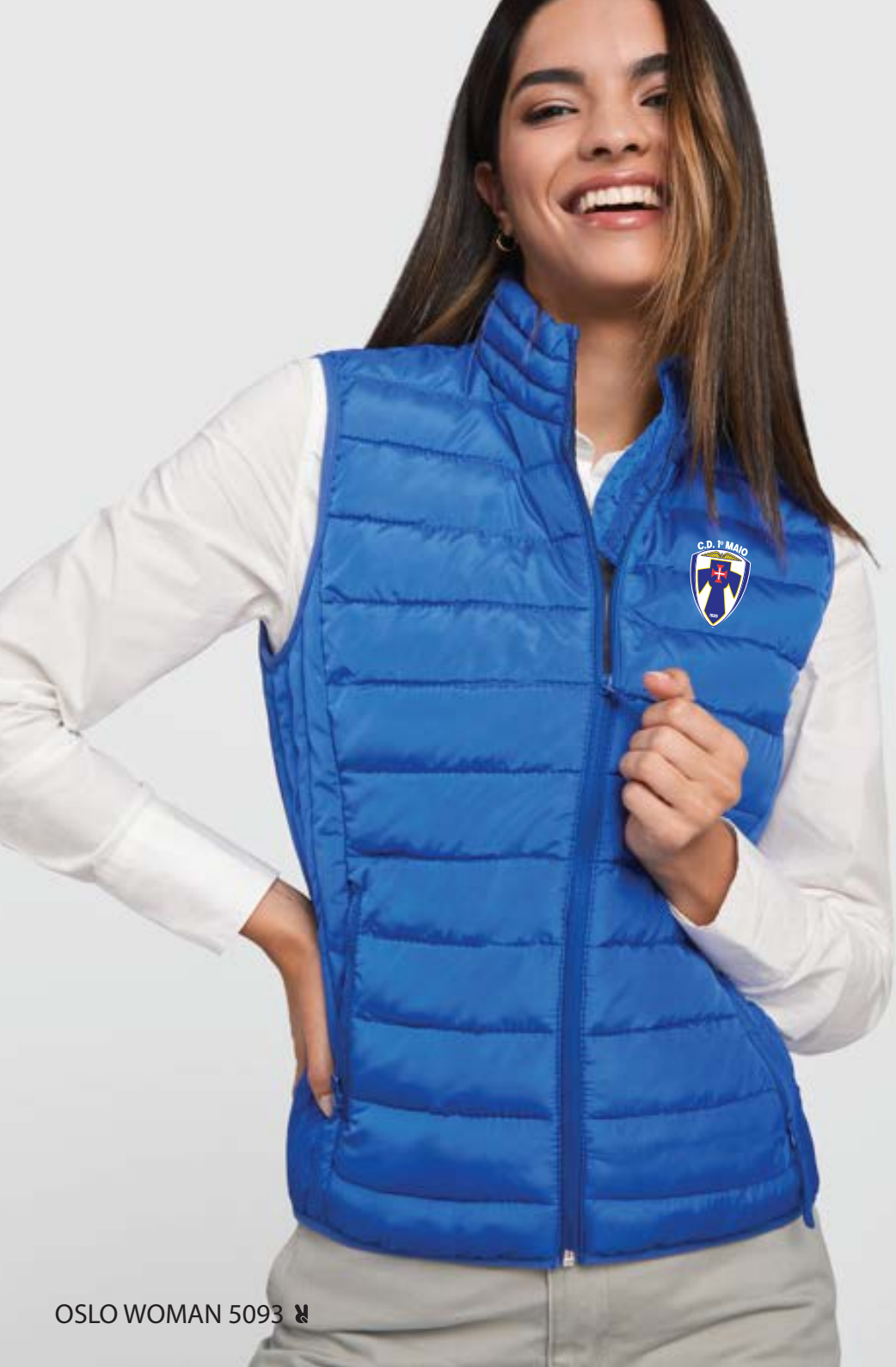
OSLO WOMAN 5093