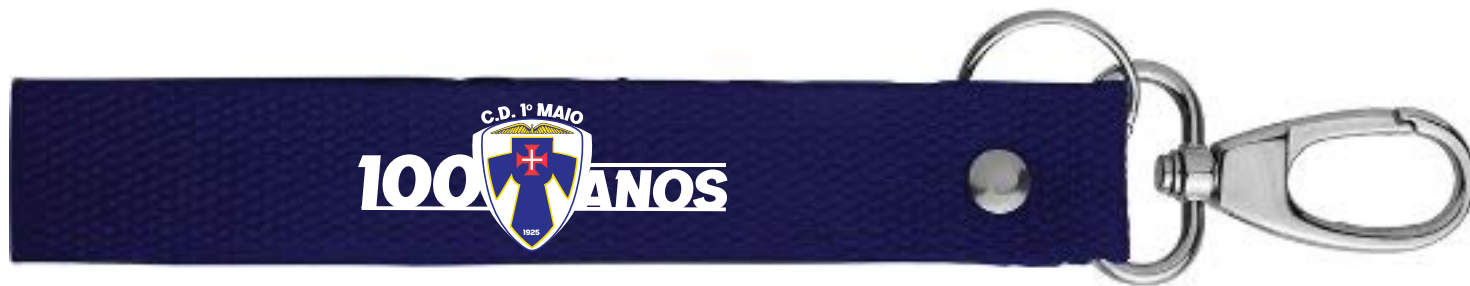
Porta-chaves alongado em algodão com mosquetão.