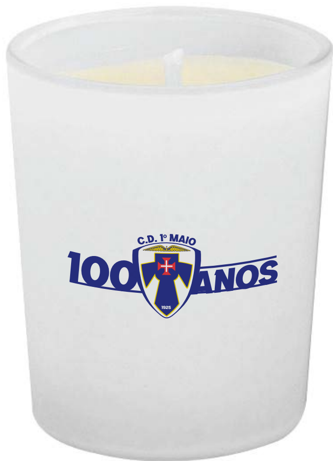
Vela de vidro de parafina aromatizada.