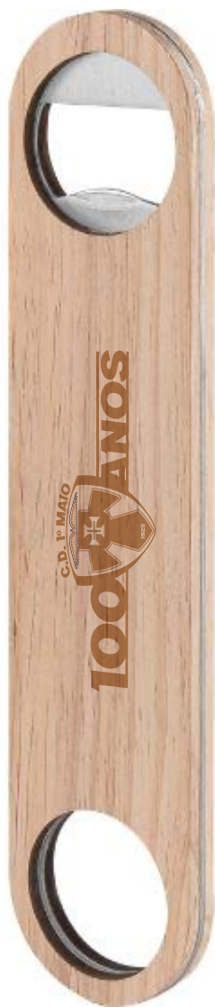
Abridor de garrafas